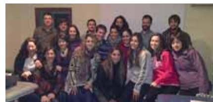
Colegiados asistentes al monográfico.

La satisfacción por parte del alumnado fue muy alta por lo que desde el Colegio se pretende volver a repetir experiencia el año que viene. □